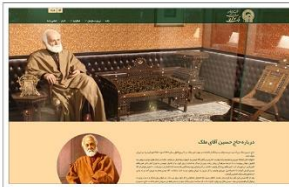
آستان قدس رضوی (موقوفات ملک) www.moghoofatmalek.ir